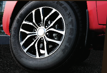
ล้อ 17 นิ้ว พร้อมยาง 245/70R17 ถนนหนทาง แข็งแรง รองรับทุกการบรรทุกหนัก