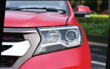
ไฟหน้าโปรเจกเตอร์ พร้อมปรับระดับ และไฟส่องสว่างกลางวัน เพื่อทัศนวิสัยที่ดีในการขับ