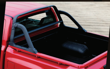
สปอร์ตบาร์ แบบ Tough Design เพิ่มความสปอร์ตและคู่คี่