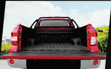
พื้นกระบะ Bed Liner ติดตั้งจากโรงงาน ให้คุณพร้อมใช้งานได้ทันที