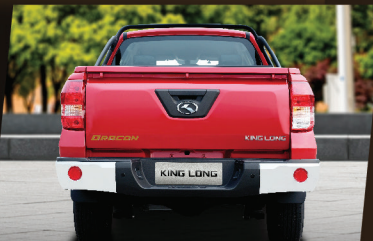
กันชนหลังโครเมียม เพิ่มความหรูหรา