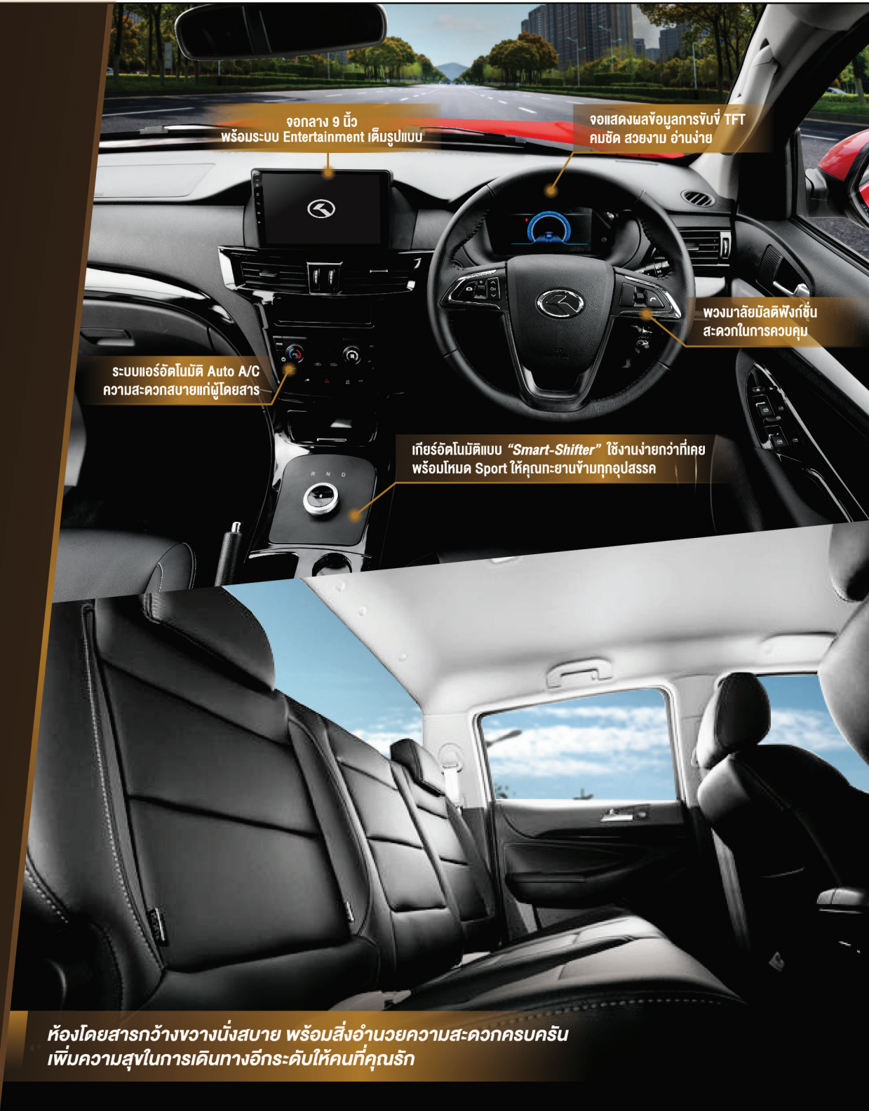
จอกลาง 9 นิ้ว พร้อมระบบ Entertainment เต็มรูปแบบ