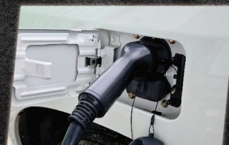
หัวชาร์จมาตรฐานยุโรป CCS2 ชาร์จเร็ว 20%-80% ภายใน 30 นาที

ที่ออกแบบมาเพื่อรองรับการบรรทุกหนัก แรงดึงแต่อกตัวด้วยมอเตอร์ไฟฟ้ากำลังสูง เพิ่มความปลอดภัยด้วยโครงสร้างโลหะแข็งแรงสูง ป้องกันแบตเตอรี่ และระบบไฟฟ้า ให้คุณมั่นใจ ปลอดภัยทุกการเดินทาง