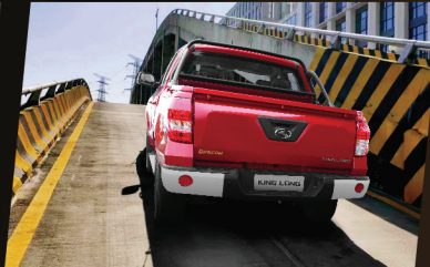
แรงดีไม่มีตกเน้นบรรทุกหนัก ได้ความชันได้สูงที่สุดถึง 30% ให้คุณมั่นใจทุกการขับ